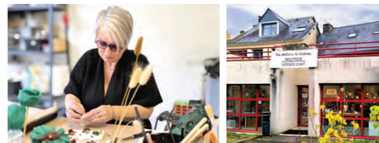
L'atelier-boutique s'est installé à l'arrière de l'Hôtel de Ville, aux côtés d'une verrière au chalumbeau et d'une bijoutière-joaillière, toutes deux artisans d'art.

Le tissu économique de Malestroit continue de se développer avec l'arrivée de deux nouvelles activités aux univers bien différents ! Une nouvelle boutique artisanale dédiée aux bougies végétales a ouvert ses portes dans le centre-ville, tandis que la start-up NeurAct , spécialisée dans les technologies du sommeil, poursuit son installation.