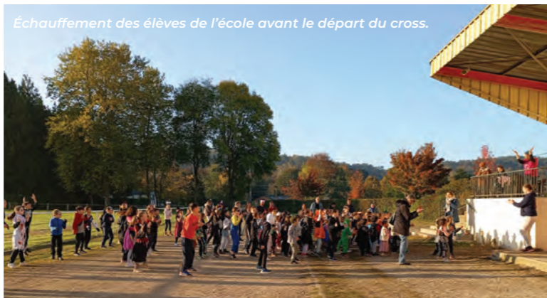
Échauffement des élèves de l'école avant le départ du cross.

i Consultez notre site internet malestroit.bzh à la rubrique "démarches administratives" pour obtenir plus de détails.