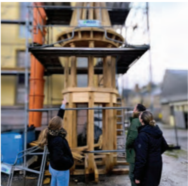
Aurélien examine le clocheton de l'Hôtel de Ville pendant la réunion de chantier.